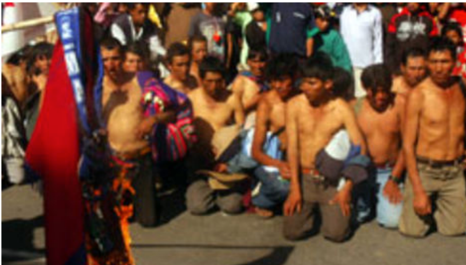
Campeños semidesnudos el 24 de mayo de 2008.

« Racisme » et discrimination dans la ville de Sucre, le 24 mai 2008.