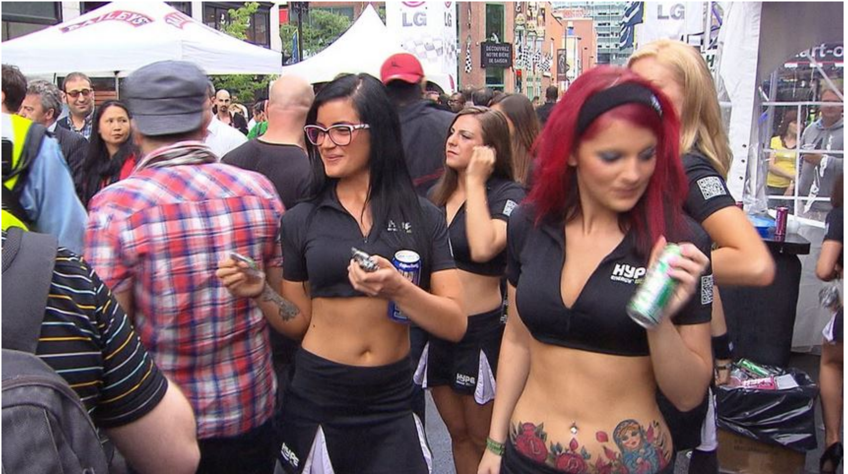
Promo girls sur la rue Crescent